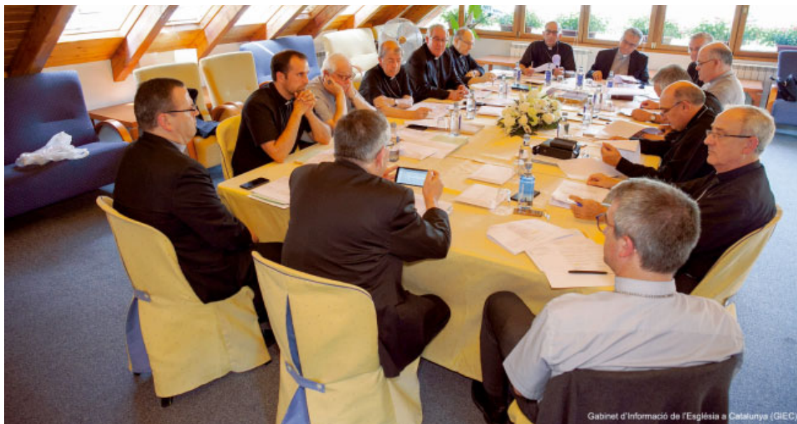
Gabinet d'Informació de l'Església a Catalunya (GIEC)